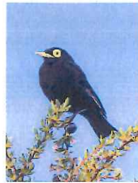
Claude SUC "Oiseaux du Chili"