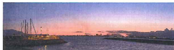
Michel LACANAUD "Paysages industriels et urbains"