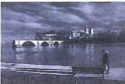
Michel BOISSEAU "Avignon"