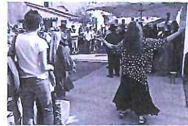
Robert ROCCHI "Scènes de rue, scènes de vie"