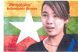
Jean-Jacques ARNAL "Mingalaba : instantanés Birman"