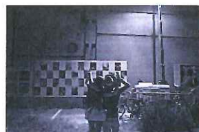
Bernard RAULET "Mes rencontres de la photographie de Arles"