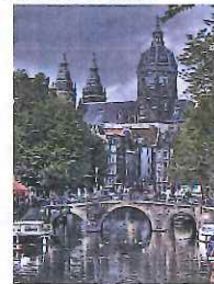
Rémy Daymond "Amsterdam"