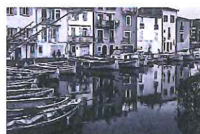
Jean-Louis PUECH "À travers mon objectif"